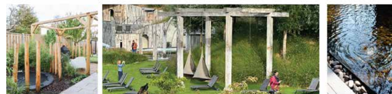
Sfeerbeelden van het ontwerp