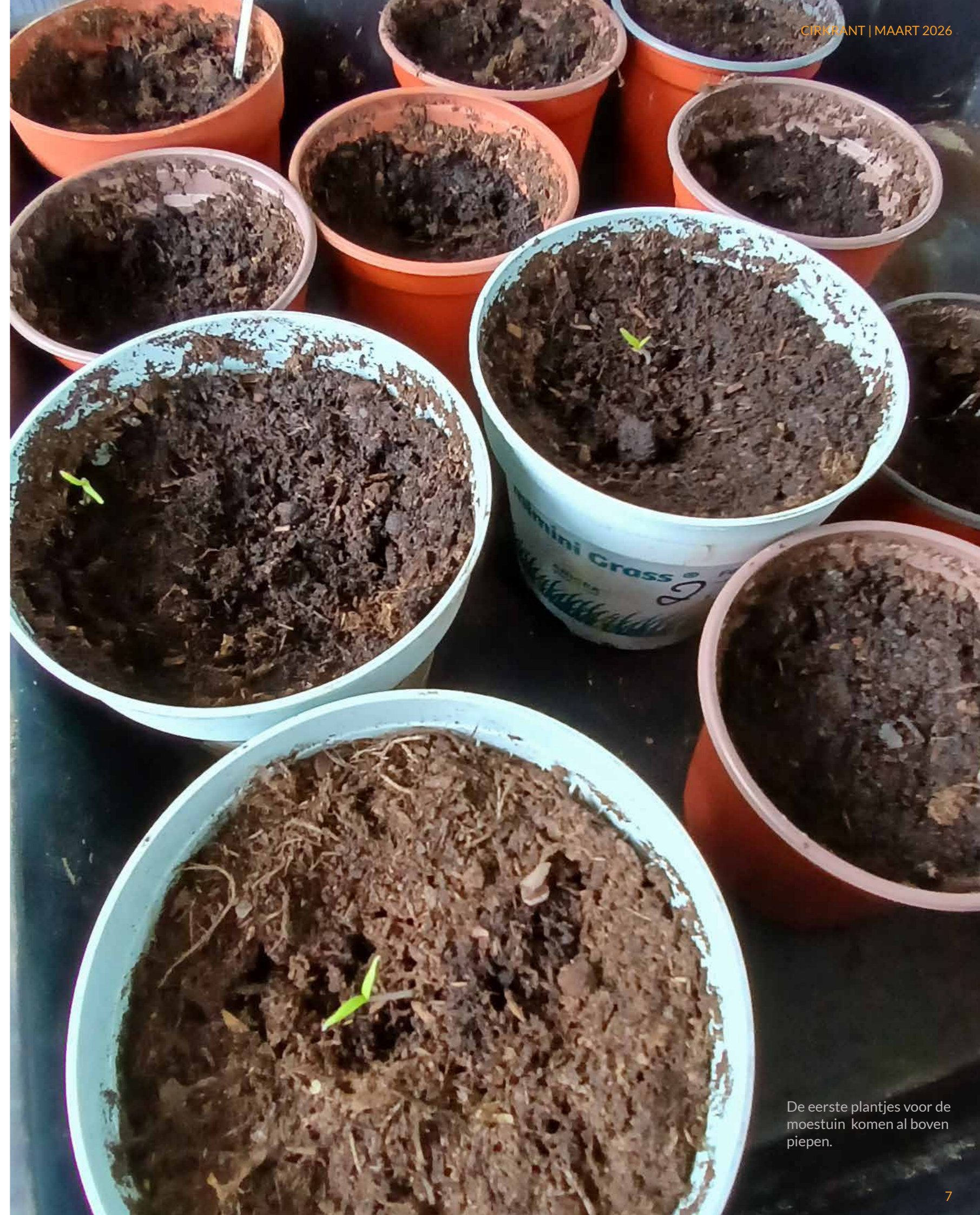
De eerste plantjes voor de moestuin komen al boven piepen.